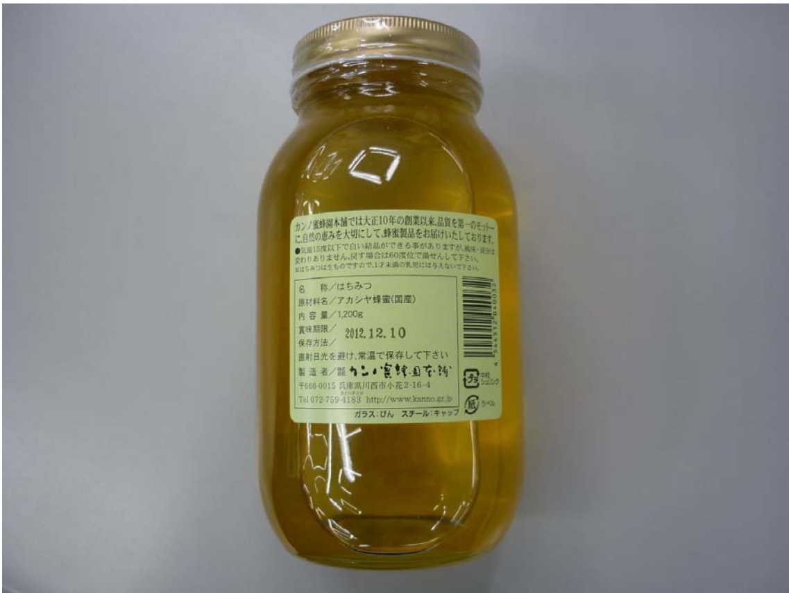
「アカシヤ蜜」 1, 200グラム入り